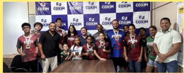
Com apoio da Prefeitura de Coxim, equipe Arruda Team de judô, conquista 11 medalhas de ouro no 21º Brasileirão da Liga Nacional