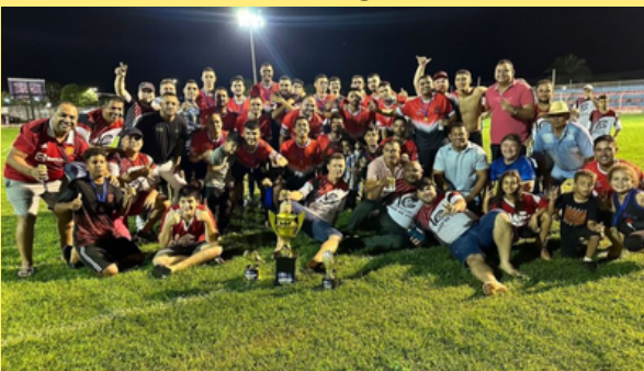
Libertá desafia as previsões e leva o título do Campeonato Municipal