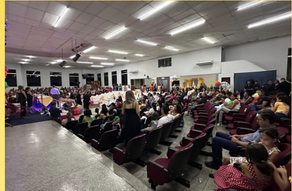
Formaturas escolar da rede municipal de ensino