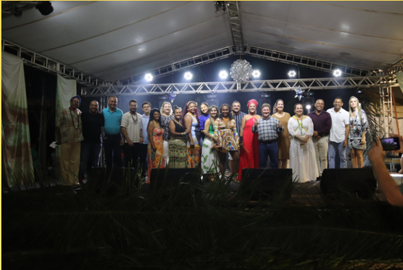
2º Concurso da Beleza Afro